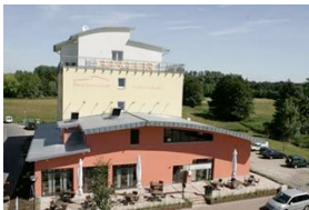
Mein Schlosshotel in Heusenstamm